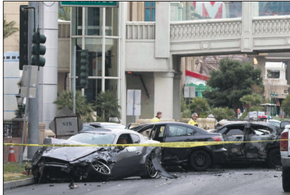
A rua em frente ao hotel-cassino Caesars Palace foi interditada pela polícia após a colisão dos veículos

Na capital do pecado, um show para os turistas: tiroteio e colisão envolvendo uma Maserati e um Range Rover deixam três mortos em frente aos principais hotéis e cassinos da cidade.